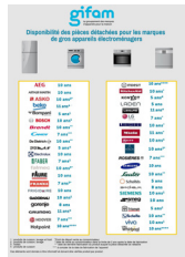
Tableaux des durées de disponibilité des pièces détachées